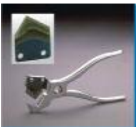
Schlauchschneider PTP mit Ersatzklingen